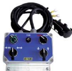
Пульт электроуправления в кабину трактора