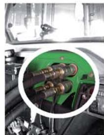
Непосредственно к гидравлическим выходам трактора